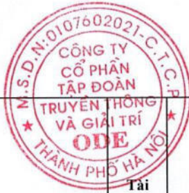
Bảng kê khai danh sách liên quan của người nội bộ